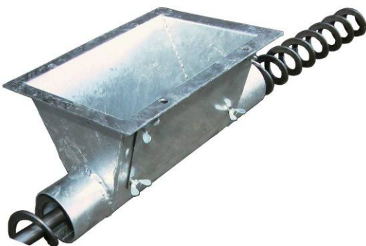
Aufnahmeteil 170 x 250mm aus Stahlblech verzinkt