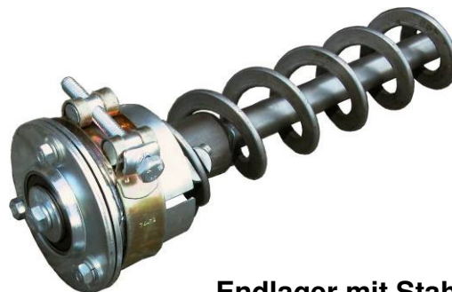
Endlager mit Stahl-Kugellager (nicht aus Kunststoff!!!)