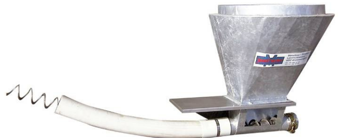
Auffangkasten für flexible Förderspiralen