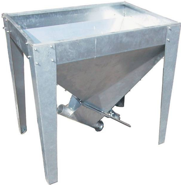
Vorrats-/Zwischenbehälter für Förderspirale Auslauf 0° oder 30° verzinktes Blech, verschraubt