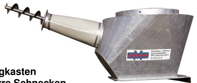
Auffangkasten für starre Schnecken beweglich 0°-25°, 25°-45°