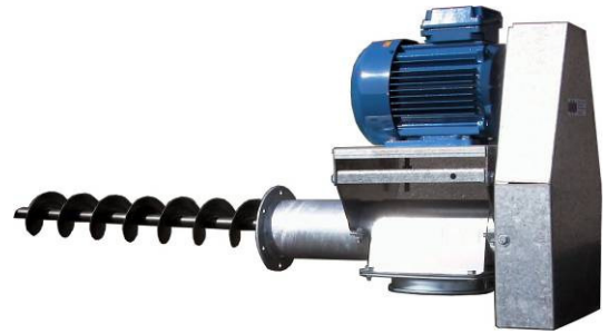
starre Förderschnecke D=100mm