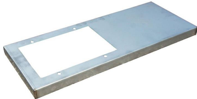
Regenabdeckung zu Schieber 170 x 250mm aus Chromstahl