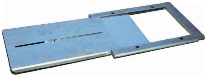
Schieber 170 x 250mm aus verzinktem Blech