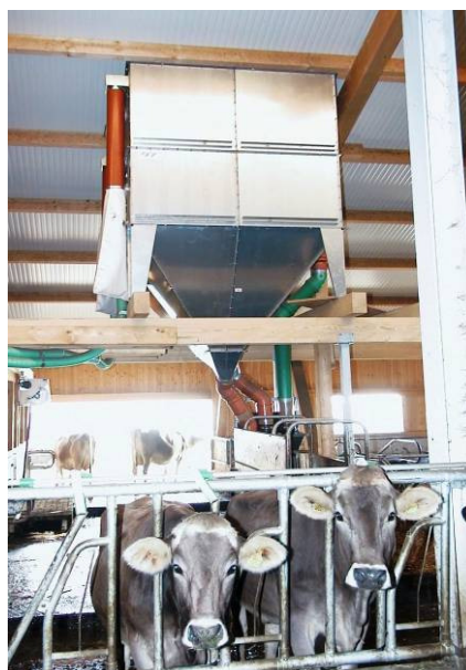
mit Auslaufkonus über eine Futterstation