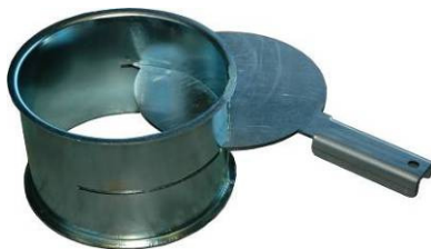
Rohrschieber zum schwenken