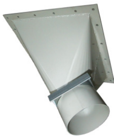
Auslaufkonus mit Notschieber