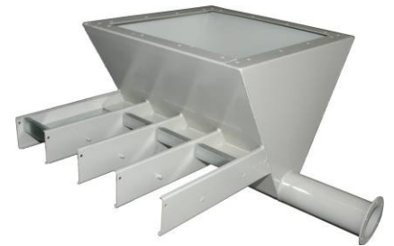
Auffangkasten für Förderschnecke mit Schieber