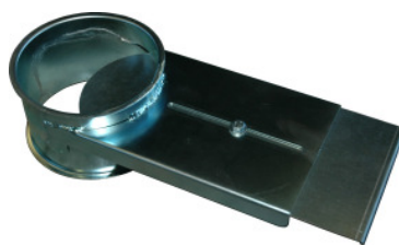
Rohrschieber zum ziehen