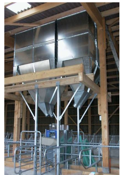
mit Auslaufkonus über zwei Futterstationen