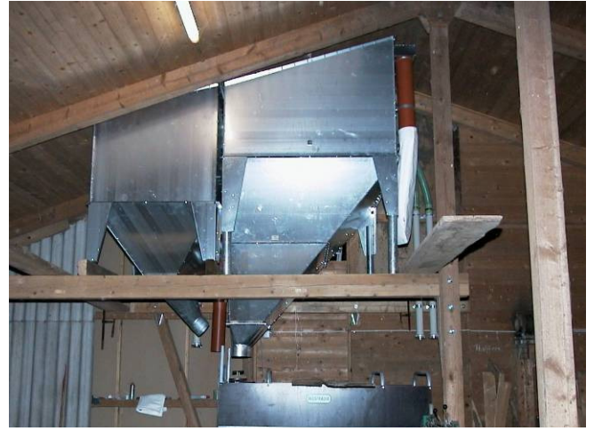
Unsere Standard-Dachschrägen: 10°, 15°, 20° und 25°.