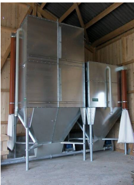
mit starren Förderschnecken