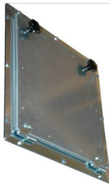
Einstiegstüre 45/45 cm mit Schnellverriegelung