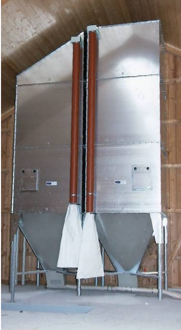
mit flexiblen Förderspiralen