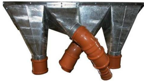
Auslaufkonus individuell angepasst