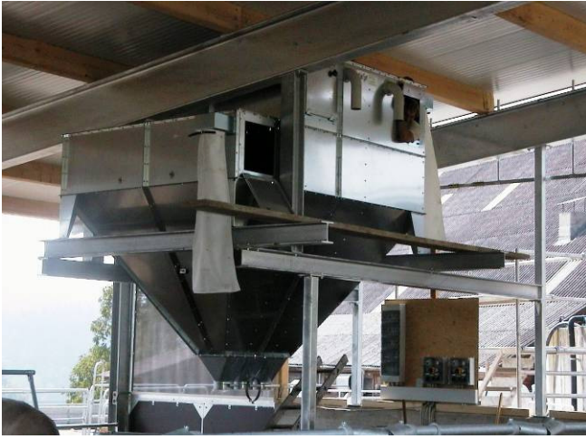
Wir passen Ihre Silos an jede mögliche und „unmögliche“ Lage an!